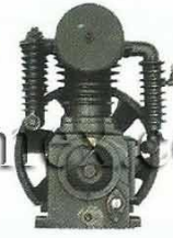
YAH1105T YAH1105TX YAH1155T

Potencia: Se refiere a las potencias de los motores recomendados para los cabezales